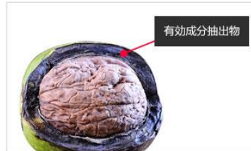
黒くるみの殻抽出物主な成分