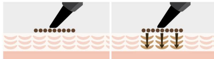
従来のタトゥー着色原理