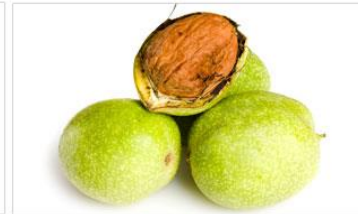
黒くるみの殻抽出物主な成分